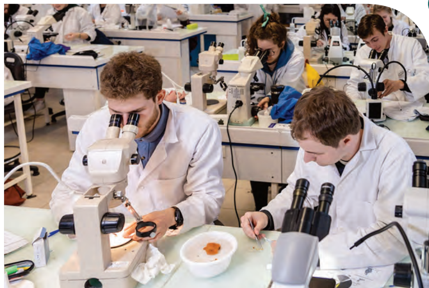
© ISFFEL - Mathieu Le Gall - SBR - SU - BLUE TRAIN