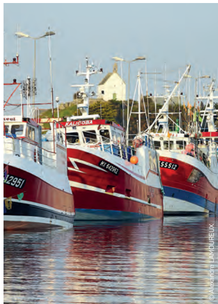
Port de Roscoff

Le Pays de Morlaix compte deux centres de ressources technologiques d'excellence : Vegenov à Saint-Pol-de-Léon, spécialiste du végétal, qui apporte des solutions R&D sur mesure aux semenciers, agrochimistes producteurs, distributeurs, et le CRT Morlaix - équipement géré par la CCIMBO Morlaix - qui apporte son expertise aux industriels du grand ouest dans les domaines de la métrologie, contrôle 3D, étalonnage et gestion de parcs d'instruments de mesure.