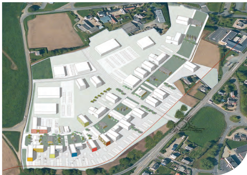
Plan de masse