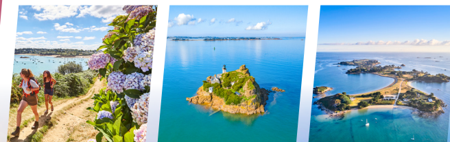
Sentiers côtiers Île Louët Île Callot