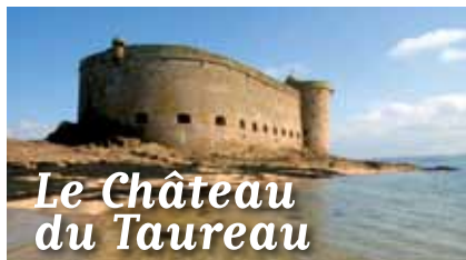
Le Château du Taureau

MAGAZINE D'INFORMATION DE MORLAIX COMMUNAUTÉ