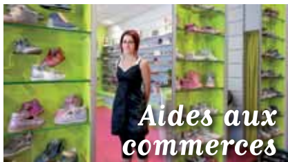
Aides aux commerces