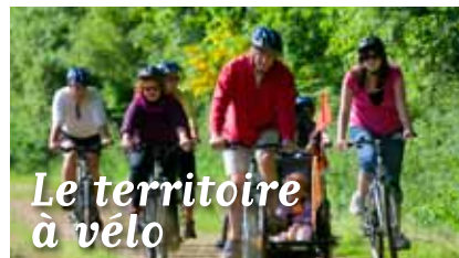
Le territoire à vélo

BOTSORHEL CARANTEC GARLAN GUERLESQUIN GUIMAËC HENVIC LANMEUR LANNÉANO LE-CLOÏTRE-ST-THÉGONNEC LE PONTYOU LOC-ÉGUINER-ST-THÉGONNEC LOCQUÉNOLE LOCQUIREC MORLAIX PLEYBER-CHRIST PLOUÉGAT-GUERRAND PLOUÉGAT-MOYSAN PLOUEZOC'H PLOUGASNOU PLOUGONVEN PLOUIGNEAU PLOUNÉOUR-MÉNEZ PLOURIN-LÈS-MORLAIX ST-JEAN-DU-DOIGT ST-MARTIN-DES-CHAMPS ST-THÉGONNEC STE-SÈVE TAULÉ