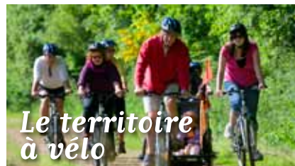
Le territoire à vélo

BOTSORHEL CARANTEC GARLAN GUERLESQUIN GUIMAËC HENVIC LANMEUR LANNÉANO LE-CLOÏTRE-ST-THÉGONNEC LE PONTYOU LOC-ÉGUINER-ST-THÉGONNEC LOCQUÉNOLÉ LOCQUIREC MORLAIX PLEYBER-CHRIST PLOUÉGAT-GUERRAND PLOUÉGAT-MOYSAN PLOUEZOC'H PLOUGASNOU PLOUGONVEN PLOUIGNEAU PLOUNÉOUR-MÉNEZ PLOURIN-LÈS-MORLAIX ST-JEAN-DU-DOIGT ST-MARTIN-DES-CHAMPS ST-THÉGONNEC STE-SÈVE TAULÉ