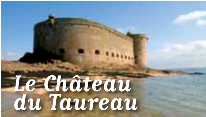
Le Château du Taureau

MAGAZINE D'INFORMATION DE MORLAIX COMMUNAUTÉ