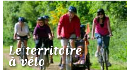
Le territoire à vélo

BOTSORHEL CARANTEC GARLAN GUERLESQUIN GUIMAËC HENVIC LANMEUR LANNÉANO LE-CLOÏTRE-ST-THÉGONNEC LE PONTYOU LOC-ÉGUINER-ST-THÉGONNEC LOCQUÉNOLE LOCQUIREC MORLAIX PLEYBER-CHRIST PLOUÉGAT-GUERRAND PLOUÉGAT-MOYSAN PLOUEZOC'H PLOUGASNOU PLOUGONVEN PLOUIGNEAU PLOUNÉOUR-MÉNEZ PLOURIN-LÈS-MORLAIX ST-JEAN-DU-DOIGT ST-MARTIN-DES-CHAMPS ST-THÉGONNEC STE-SÈVE TAULÉ